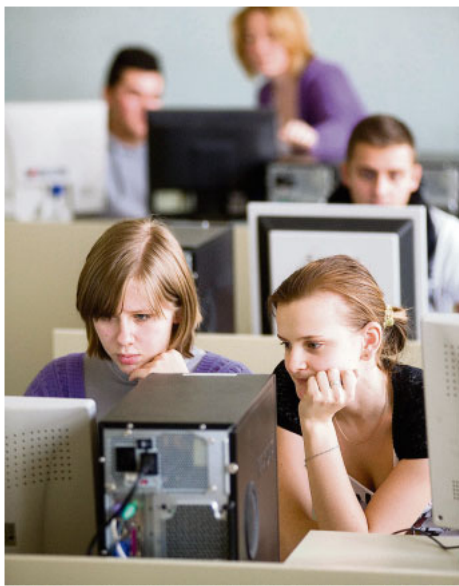
An der Praxis orientiert: Unterricht am Rechner in der Klingerschule und im Labor für Elektrotechnik der Heinrich-Kleyer-Schule

In Frankfurt gibt es zwei Berufliche Gymnasien: außer der Heinrich-Kleyer-Schule noch die Klingerschule. Beide liegen im Nordend – Erstere am Hessischen Rundfunk, die andere in der Nähe des Bethmann-Parks. Im Vergleich mit anderen Schulen, die zum Abitur führen, ist die Zahl ihrer Schüler überschaubar. Zusammen haben sie etwa so viele Klassen wie die Sekundarstufe II eines herkömmlichen Gymnasiums. Allerdings können die Kleyer- und die Klingerschule ihren Schülern etwas bieten, das diese sonst selten finden: Während viele andere Schulen erst im Begriff sind, ein spezifisches Profil zu entwickeln, sind klare Schwer-