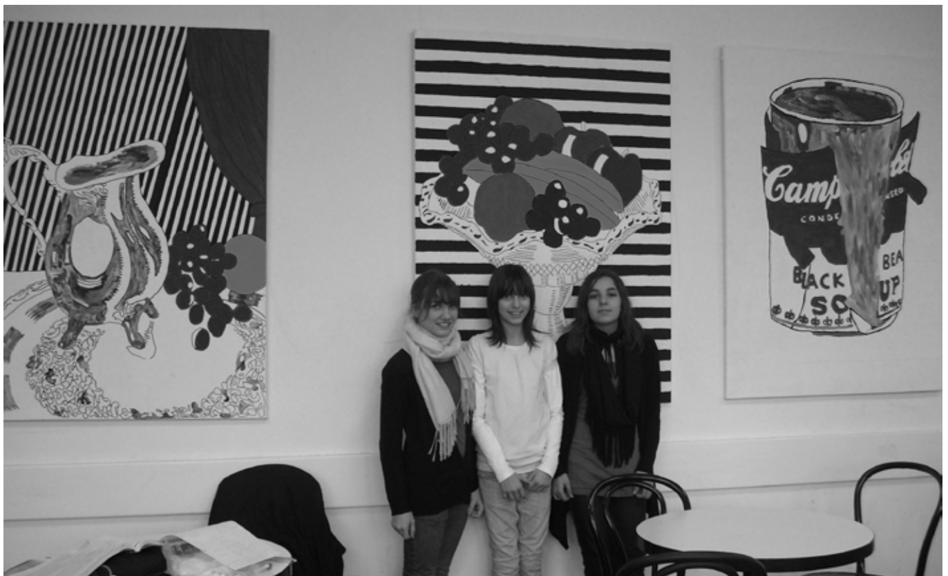
Alles dreht sich ums Essen - auch die neuen Bilder an der Wand der Cafeteria.

Dafür hat die Kunst AG, Jahrgang 6, gesorgt.